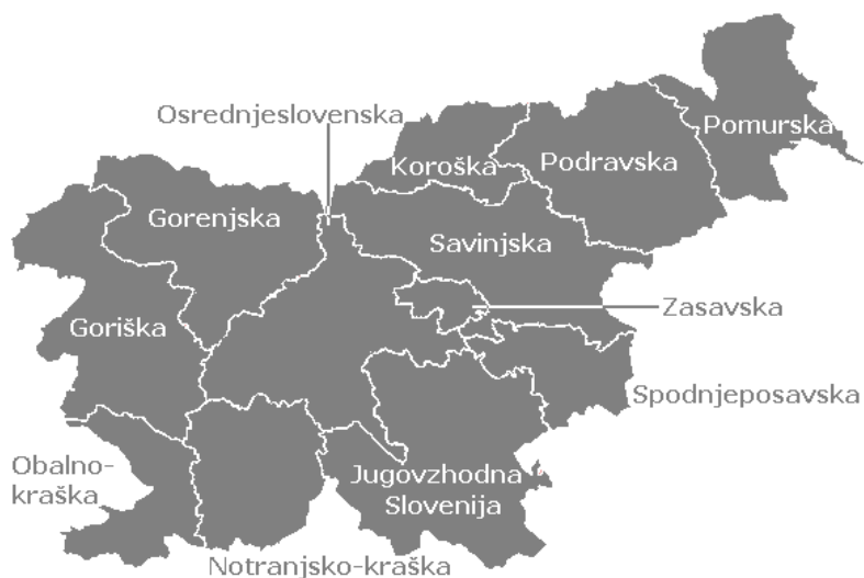
Slika : Statistične regije v Republiki Sloveniji