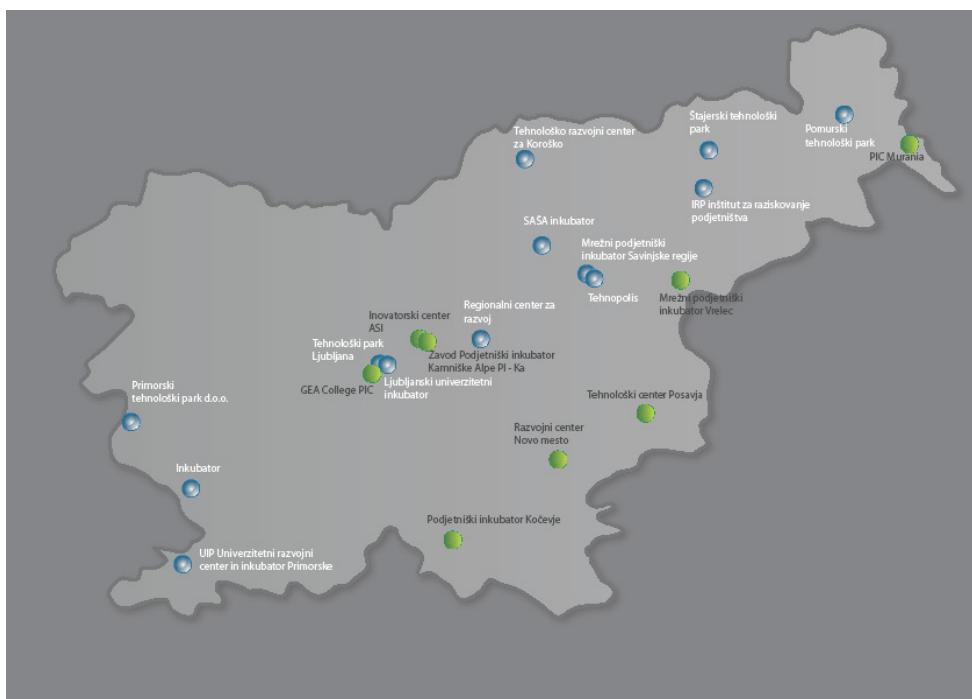
Slika : Subjekti iz evidence B

V spodnjem zemljevidu so subjekti iz evidence B označeni z zeleno barvo.